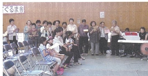
「第27回ふれあいひろば」で歌いました