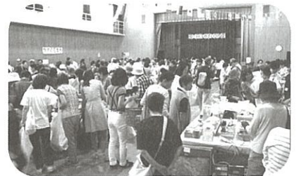
「ふれあいひろば」バザー会場