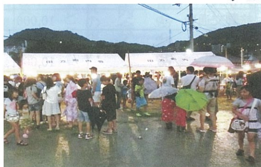
田方 雨が降ったりやんだりしましたが楽しめました!

古江盆踊り大会 日時 8月22日(土) 午後6時〜 場所 古江新宮神社 地域の子ども会、青年会、古江新宮神社保存会などの夜店があります。